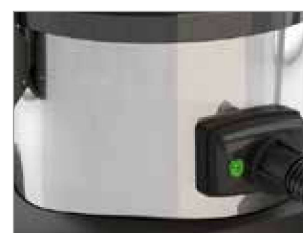
DEPÓSITO EN ACERO