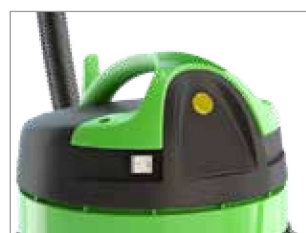
TESTIGO LUMINOSO SATURACIÓN DE BOLSA