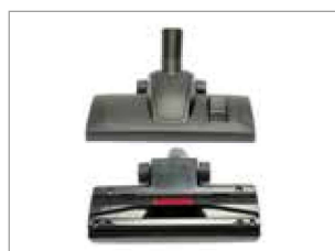
NUEVA BOQUILLA CON ALTA EFICACIA DE LIMPIEZA