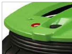
INDICADOR DE SATURACIÓN DEL FILTRO