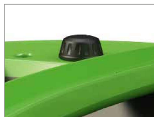
REGULADOR DE VELOCIDAD