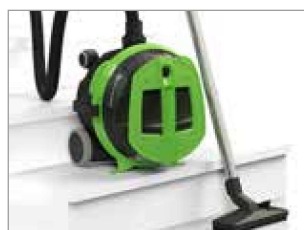
POSICIÓN DE ESTACIONAMIENTO EN ESCALERA