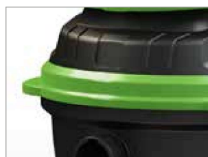
PROTECCIÓN LATERAL PARA PUERTAS Y PAREDES