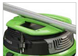
ASA ERGONÓMICA CON PORTACABLE INTEGRADO