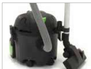
CLIP PORTA ACCESORIOS