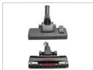
NUEVA BOQUILLA CON ALTA EFICACIA DE LIMPIEZA