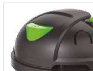
INTERRUPTOR DE ENCENDIDO/APAGADO ACCIONABLE CON EL PIE