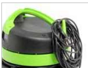
GANCHO PARA CABLE