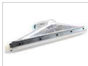
BOQUILLA ESPECIAL PARA LIMPIEZA DE HORNOS, RESISTENTE A LA ALTA TEMPERATURA (HASTA 200°C)