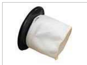
FILTRO RESISTENTE A ALTA TEMPERATURA